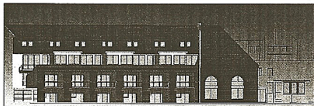
NEU NEBEN ALT: Die Zeichnung zeigt die Ansicht zur Plantagenstraße.

Preisbewusst in die eigenen vier Wände → Nächste Seite